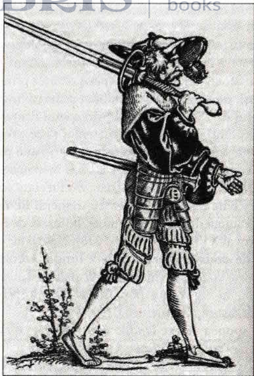
Landsknecht sau mercenar ger- man (c. 1550)

Câțiva soldați au început să măcelărească, să fiarbă și să frigă diverse, în timp ce alții au năvălit prin casă de sus până-n jos. Unii au făcut o boccea uriașă de pânzeturi, țoale și toate tipurile de bunuri gospodărești, distrugând tot ceea ce nu doreau să ia cu ei. Câțiva și-au înfipt baionetele în paie și fân, de parcă nu ar fi avut deja suficiente oi și porci de sacrificat. Mulți dintre ei au golit plăpumiile de pene și le-au umplut cu șunci, în timp ce alții puneau carne și alte acareturi în ele. Câțiva au dărâmat cuptorul și ferestrele, distrugând tacâmurile din cupru și spărgând farfuriile. Toate paturile, mesele, taburetele și băncile fură arse, iar oalele și fundurile de tocat – stricate. O servitoare a fost atât de rău tratată în hambar încât nu s-a mai putut mișca după aceea. Pe servitorul nostru l-au legat și l-au culcat pe jos, i-au îndesat o pâlnie pe gură și apoi i-au turnat